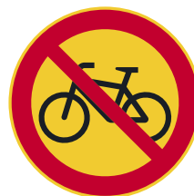
Pol-ku-pyö-räl-lä a-jo kiel-let-ty