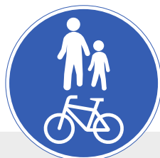
Yh-dis-tet-ty pyö-rä-tie ja jal-ka-käy-tä-vä