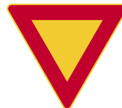
Väis-tä-mis- vel-vol-li-suus ris-teyk-ses-sä